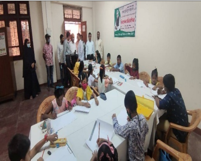
১৭ ই মার্চ জাতীয় শিশু দিবস উপলক্ষে চিত্রাঙ্কন প্রতিযোগীতায় অংশগ্রহণকারীগণের চিত্র