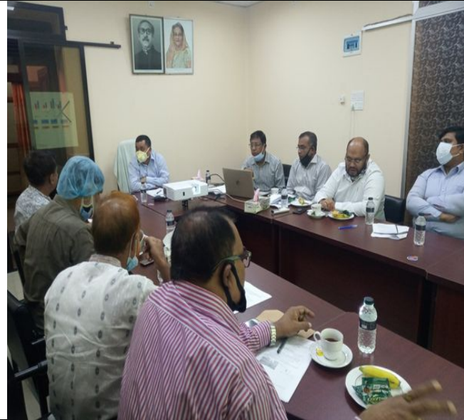
সেবা সহজিকরনের লক্ষে স্টেকহোল্ডারদের সাথে মত বিনিময় সভা