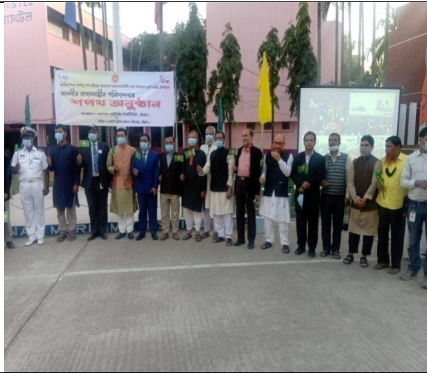
মহান বিজয় দিবস অনুষ্ঠান উদযাপন