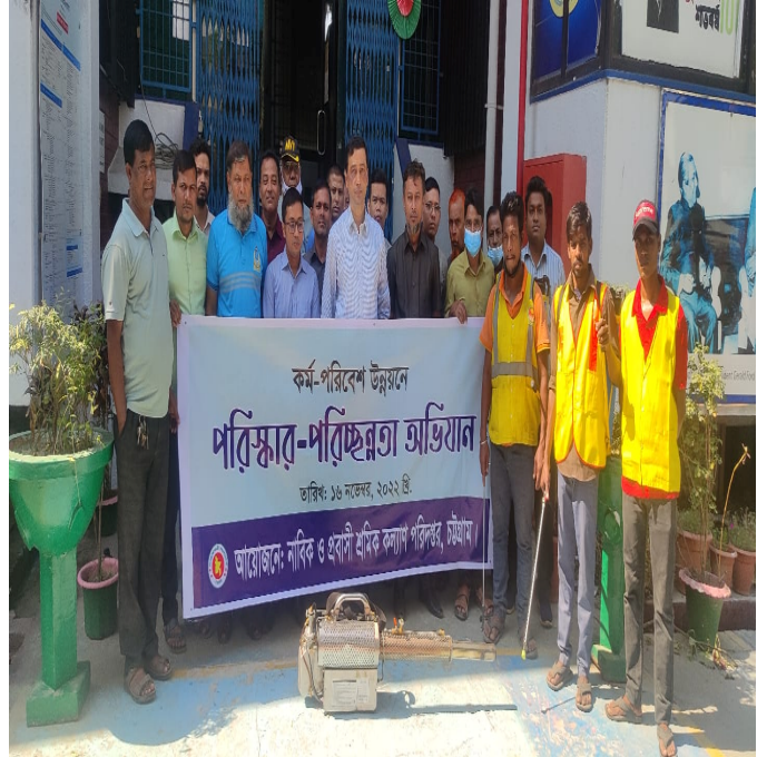
কর্ম-পরিবেশ উন্নয়নে 'পরিষ্কার-পরিচ্ছন্নতা অভিযান'