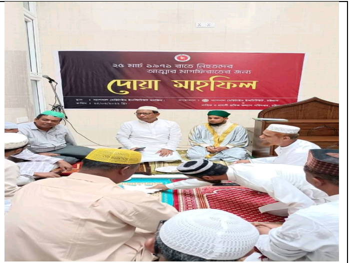
১৯৭১ সালের ২৫ মার্চ রাতে নিহতদের আত্মার মাগফিরাত কামনায় বিশেষ দোয়া মাহফিল