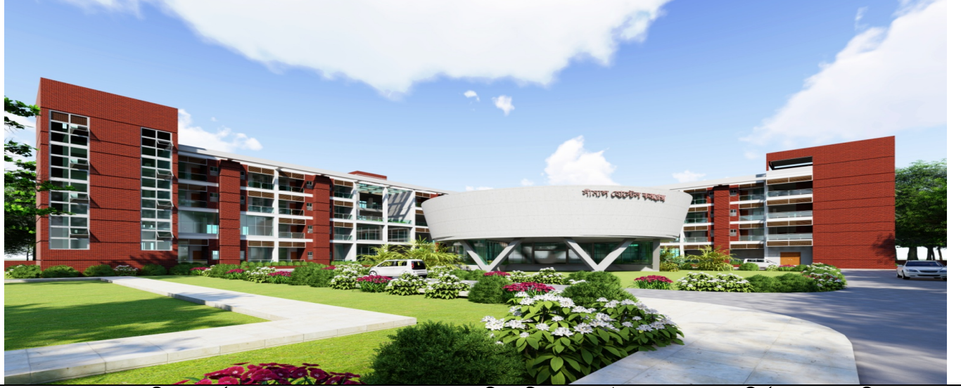
স্থাপত্য অধিদপ্তর কর্তৃক প্রস্তুতকৃত ও একনেক সভায় অনুমোদিত ‘সীম্যান্স হোস্টেল কমপ্লেক্স ভবন’ নির্মাণের স্থাপত্য চিত্র

নাবিকদের সাময়িক আবাসন, বিনোদন ও অন্যান্য কল্যাণ মূলক কার্যক্রমে চিহ্নিত সমস্যা উত্তরণের লক্ষে মন্ত্রণালয়ের ২৫-১১-২০২০খ্রিঃ তারিখের অভ্যন্তরীণ যাচাই কমিটির সভার সিদ্ধান্ত অনুযায়ী সীম্যান্স হোস্টেল চৌহদ্দির পূর্বাংশের খালি জায়গায় ইন্টারন্যাশনাল সীফারার্স ডপ-ইন সেন্টার ও সীম্যান্স হোস্টেল এর সমন্বয়ে ৬ (ছয়) তলা ভীত বিশিষ্ট ৪(চার) তলা “সীম্যান্স হোস্টেল কমপ্লেক্স ভবন নির্মাণ” শীর্ষক প্রকল্পটি ৫৯১৪.১৩ লক্ষ টাকা প্রাক্কলিত ব্যয়ে জাতীয় অর্থনৈতিক পরিষদের নির্বাহী কমিটি (একনেক)- এর সভায় সদয় অনুমোদন হয়েছে। ইতিমধ্যে উক্ত প্রকল্পের নির্মাণ কাজ ও পূর্ত কাজের দরপত্র আহবান করা হয়েছে।