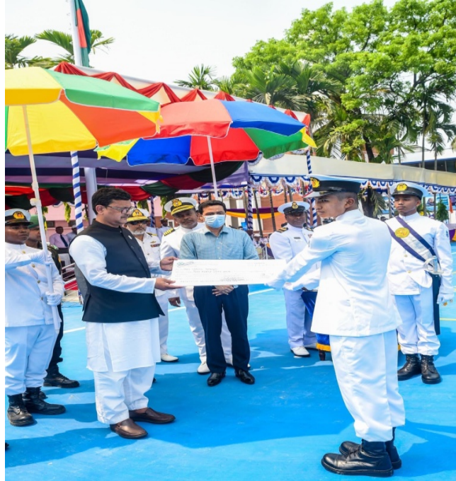
মুজিব বর্ষ উপলক্ষে প্রশিক্ষণার্থী নবীন নাবিককে সেবা কৃতিত্বের জন্য এককালীন প্রনোদনা/পুরস্কার প্রদানের চিত্র