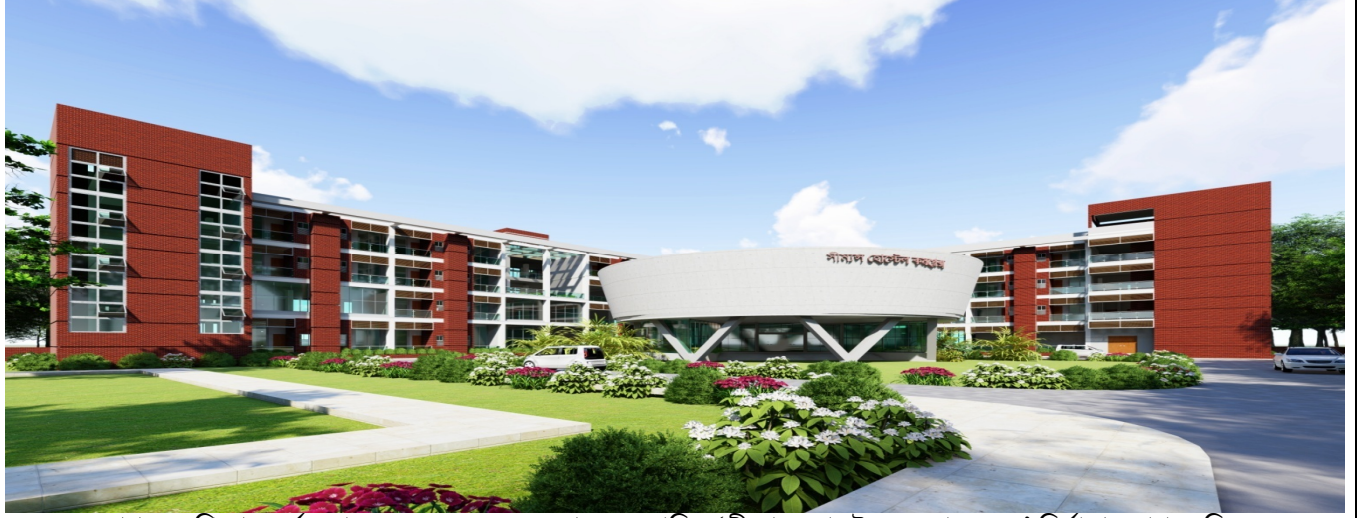
স্থাপত্য অধিদপ্তর কর্তৃক প্রস্তুতকৃত ও একনেক সভায় অনুমোদিত 'সীম্যাপ্স হোস্টেল কমপ্লেক্স ভবন' নির্মাণের স্থাপত্য চিত্র

বৈদেশিক মুদ্রা অর্জনের মধ্য দিয়ে দেশের অর্থনীতিতে অনবদ্য ভূমিকা রেখে চলা নাবিকদের কল্যাণ সুবিধা বৃদ্ধিকল্পে সীম্যাপ্স হোস্টেল চৌহদ্দির পূর্বাংশের খালি জায়গায় ইন্টারন্যাশনাল সীফারার্স ড্রপ-ইন সেন্টার ও সীম্যাপ্স হোস্টেল এর সমন্বয়ে ৬(ছয়) তলা ভীত বিশিষ্ট ৪(চার) তলা সীম্যাপ্স হোস্টেল কমপ্লেক্স ভবন নির্মাণ করা।