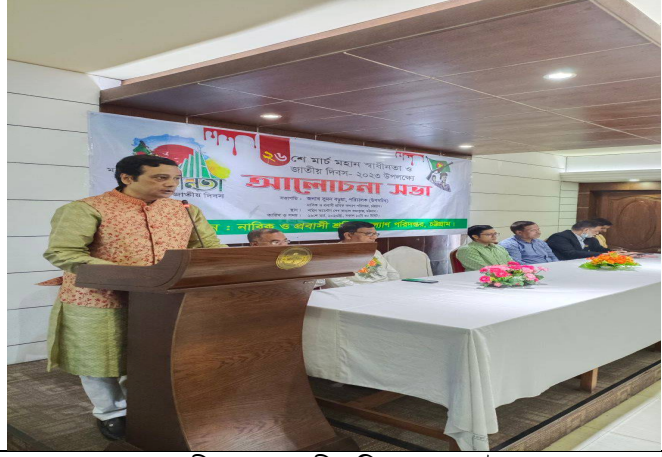
মহান স্বাধীনতা ও জাতীয় দিবস-২০২৩ উদযাপন