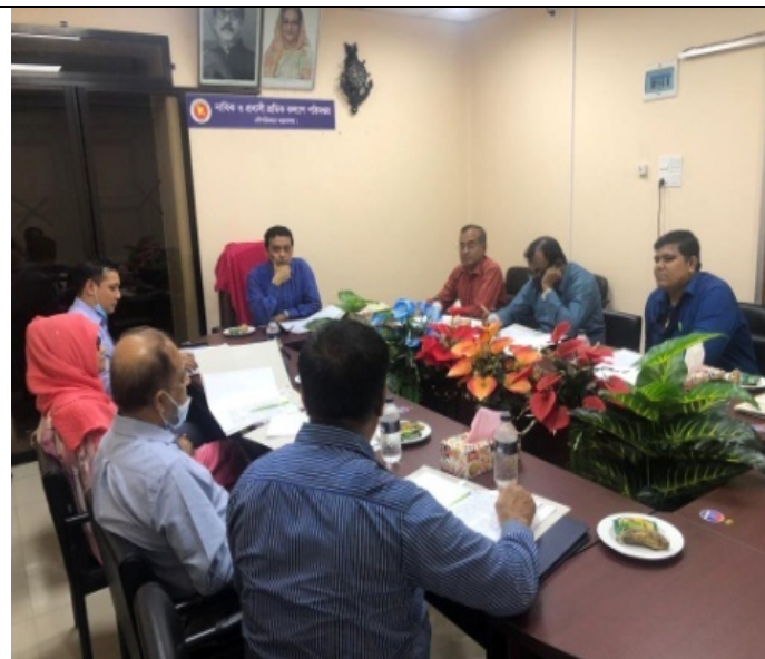
দুঃস্থ-অসুস্থ নাবিকদের আর্থিক সহায়তা প্রদানকল্পে নাবিক কল্যাণ তহবিল পরিচালনা কমিটির সভার চিত্র