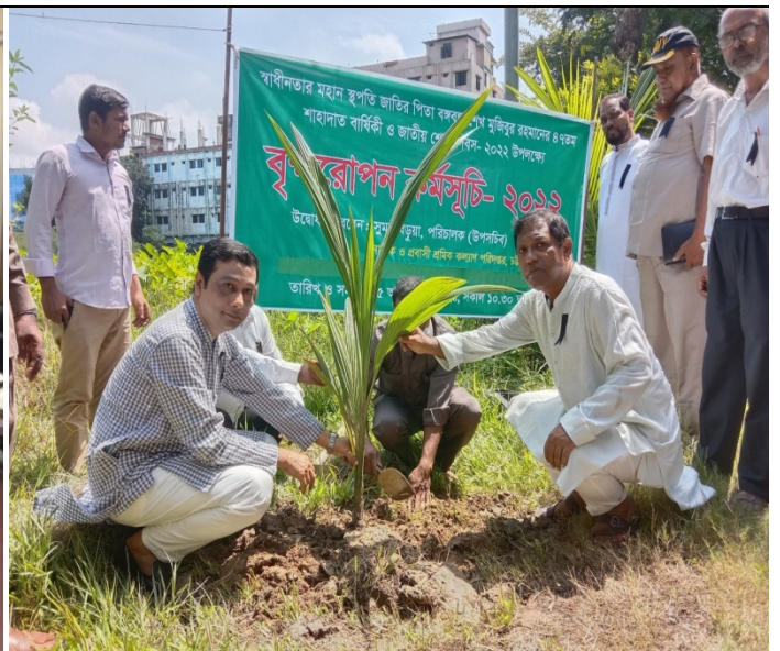
জাতীয় শোক দিবস উপলক্ষে বৃক্ষরোপন কর্মসূচি