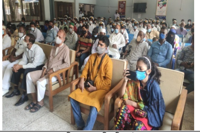
মহান স্বাধীনতা ও জাতীয় দিবস উদযাপন