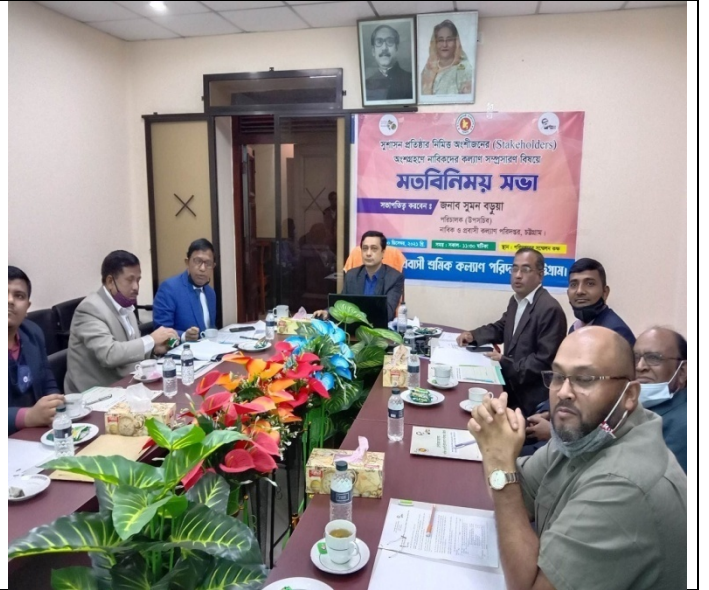
সেবা সহজিকরনের লক্ষে স্টেকহোল্ডারদের সাথে মত বিনিময় সভা