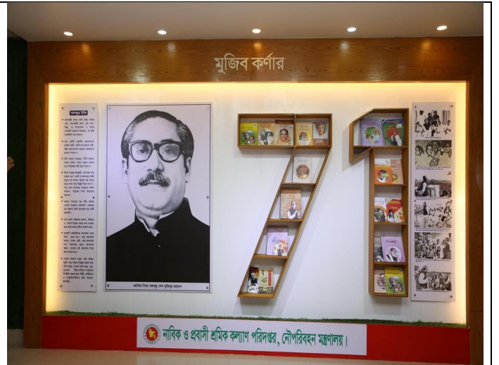
মুজিববর্ষ উপলক্ষে নাবিক ও প্রবাসী শ্রমিক কল্যাণ পরিদপ্তরাধীন সীম্যাস হোস্টেল, চট্টগ্রামের ভর্তি-বিদায় কাউন্টারের সম্মুখে মুজিবকর্ণার স্থাপন করা হয়।