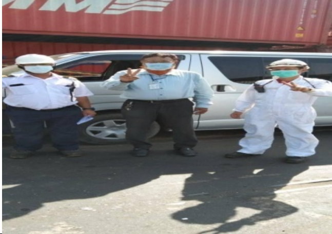
চট্টগ্রাম বন্দরে আগত বিদেশী নাবিকদের ফ্রি ট্রান্সপোর্ট সুবিধা প্রদান