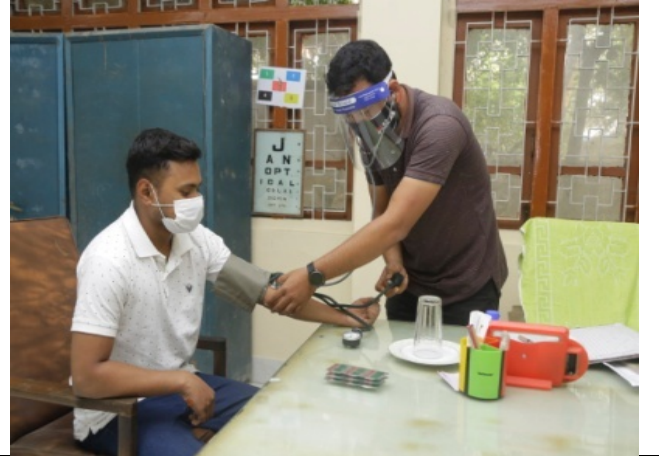
সীম্যাস হোস্টেল ডিসপেন্সারিতে নাবিকদের চিকিৎসা সুবিধা প্রদান